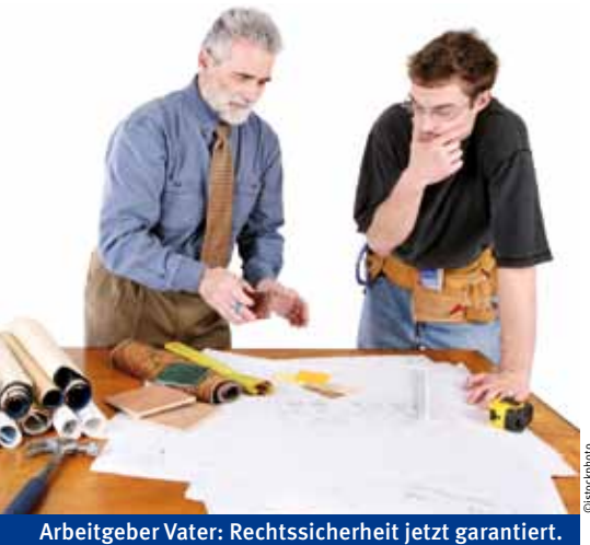
Arbeitgeber Vater: Rechtssicherheit jetzt garantiert.

Seit Juni 2010 entscheidet die Clearingstelle der Rentenversicherung Bund bei im Familienbetrieb beschäftigten Angehörigen auch über eine etwaige Sozialversicherungspflicht. Mehr Rechtssicherheit ist die Folge.